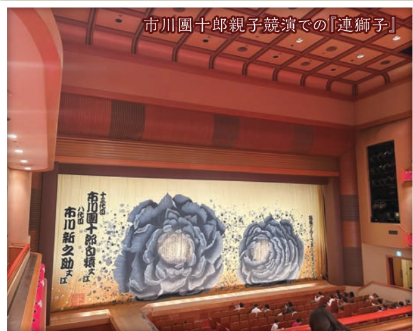
市川團十郎親子競演での『連獅子』

幕間に食べるお弁当を楽しみに、見どころはイヤホン解説をたよりにして歌舞伎の世界にもどっぷりとこれからも浸りたいと思っています。